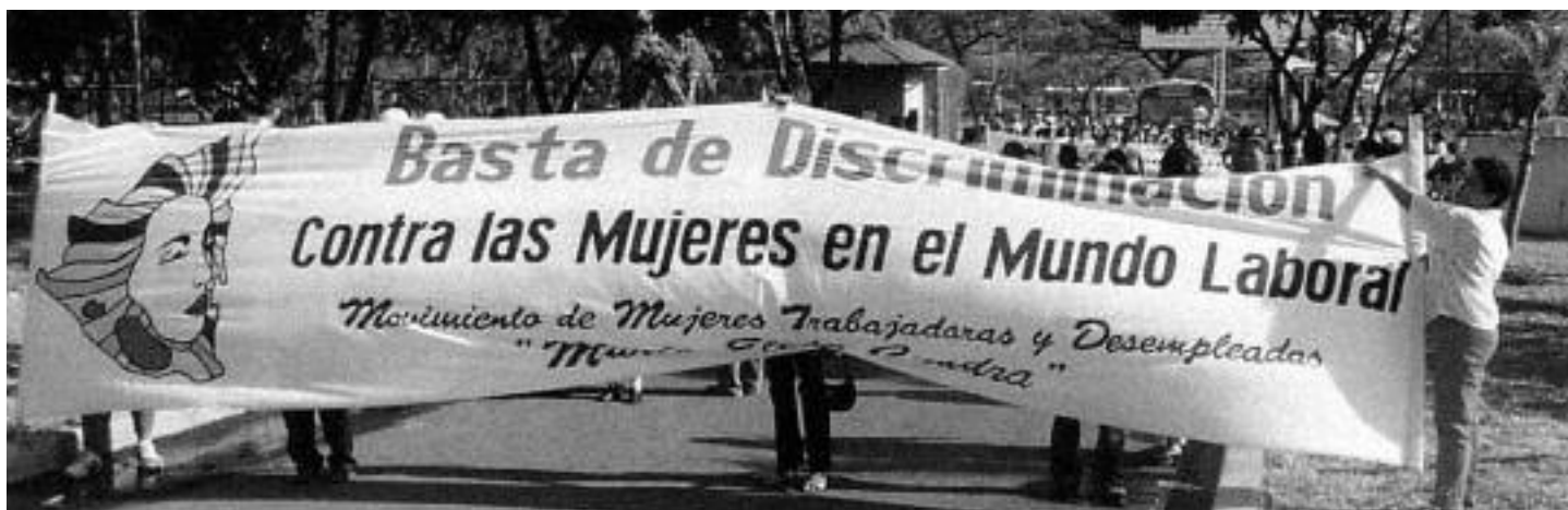
Marchas Públicas del MEC

Unión Europea, lo cual unió a aproximadamente 1,200 mujeres para aprender, debatir y analizar la nueva propuesta de iniciativa de libre comercio para la región. 2