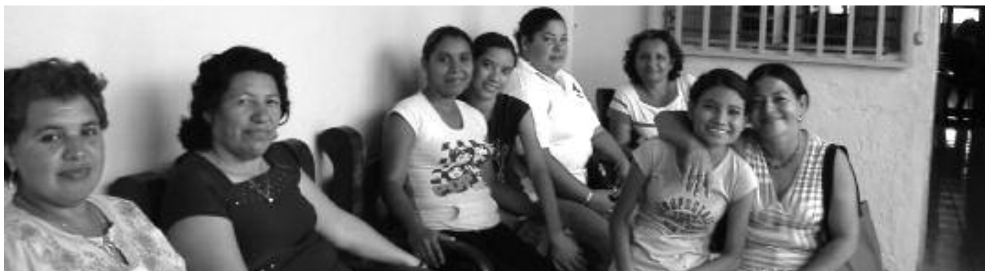
Grupos Focales, Mayo 2008

Las mujeres comprendieron que su situación de pobreza material incrementaba su vulnerabilidad, e identificaron diversos tipos de pobreza – no sólo en relación al dinero si no también pobreza emocional, la falta de conocimiento y educación. Consideran que la pobreza es causada por la mala administración de recursos nacionales por parte del gobierno. Pero también es resultado de la falta de capacitación técnica y título secundario, lo cual significa que las mujeres tienen menos oportunidades de trabajo y son forzadas a tomar empleos mal remunerados. Para estas mujeres, pobreza significa no ganar lo suficiente para satisfacer las necesidades básicas, teniendo que priorizar lo que pueden comprar. Pobreza también significa el no saber cómo defender y disfrutar sus derechos.