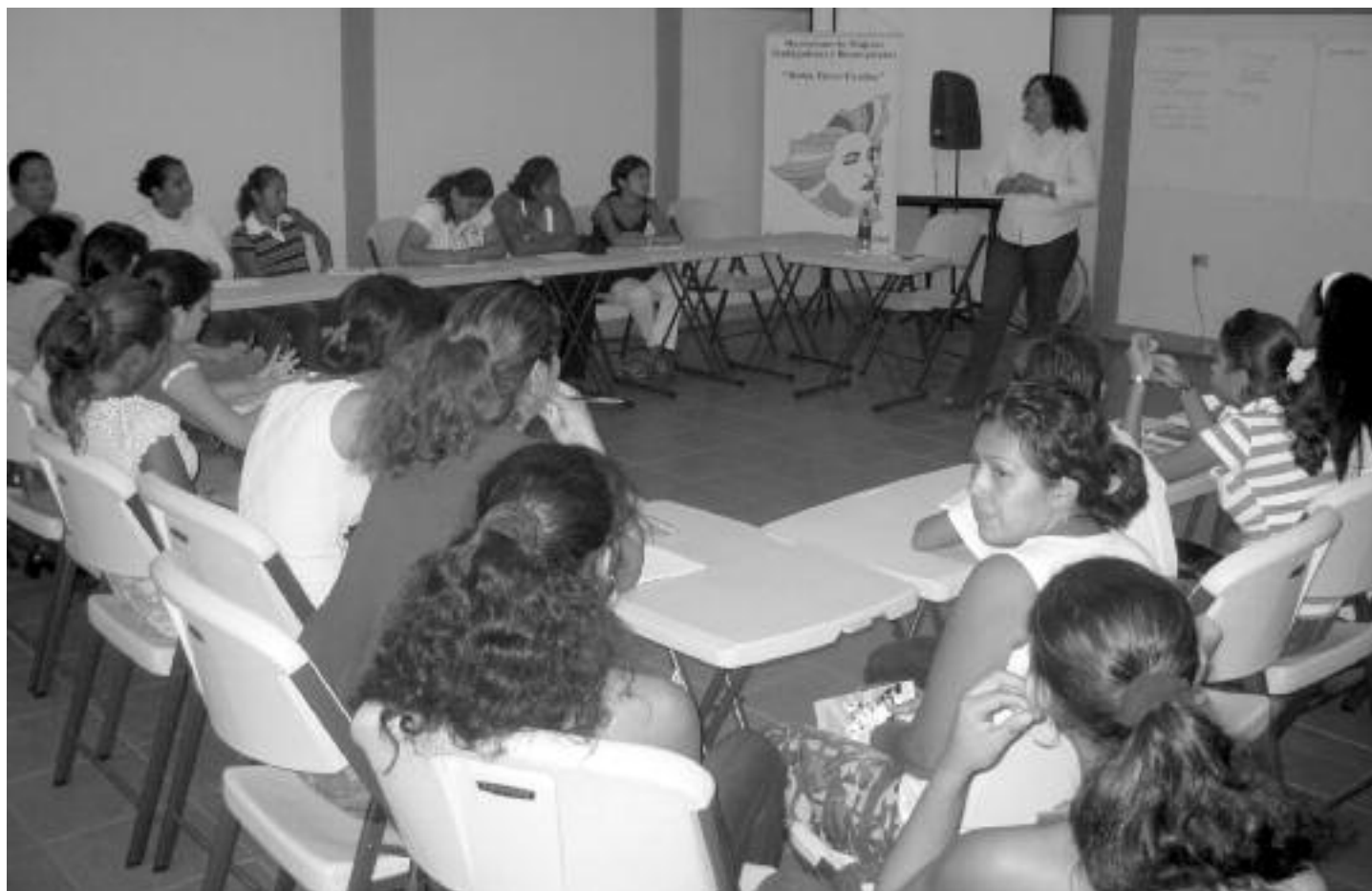
72 mujeres participaron en los grupos focales en Managua, Masaya y Nindirí. Mayo 2008.

Por medio de los cursos sobre Género & Autoestima, y Alfabetización Económica, se promueve la equidad de género tanto en el hogar como en el lugar de trabajo. Las mujeres con quienes hablamos en los grupos focales se referían constantemente a cambios en el hogar ya que maridos e hijos estaban contribuyendo a las tareas domésticas y cuidando a los niños, de manera que las mujeres se sentían más libres de participar en las actividades del MEC. Ellas atribuyen esto a la capacitación recibida en los talleres ya que como consecuencia habían podido tomar conciencia de la división del trabajo y de los derechos de la mujer.