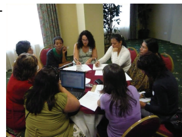
2009 Reunión regional de FEIM en Panamá, que incluyó una discusión sobre la Campaña GEAR.

Plataforma de acción de Beijing (PAB): La PAB constituye el marco de referencia más exhaustivo sobre los derechos de las mujeres, abordando doce áreas fundamentales entre las cuales se cuentan: la mujer y la pobreza, la educación y la capacitación de la mujer, la mujer y la salud, la violencia contra la mujer, la mujer y el conflicto armado, la mujer y la economía, la participación de la mujer en el poder y en la toma de decisiones, los mecanismos institucionales para el adelanto de la mujer, los derechos humanos de la mujer, la mujer y los medios de comunicación, la mujer y el medio ambiente, y la niña. Utilicen la PAB como base para las demandas de su organización y vayan más allá de ella para garantizar que la ONU Mujeres funcione para el siglo XXI. También consulten las revisiones a cinco años (2000) , a diez años (2005) y a quince años (2010) de la Plataforma de Acción.