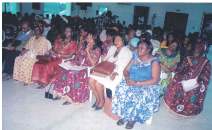
Julio de 2010. Servitas Camerún organizó un evento sobre GEAR.

2008-2009: La red de organizaciones de mujeres, justicia social y derechos humanos comenzó oficialmente a funcionar como Campaña GEAR durante la sesión de 2008 de la Comisión de la Condición Jurídica y Social de la Mujer, acuñando la consigna “Construyendo unas Naciones Unidas que funcionen de verdad para todas las mujeres – Campaña por una reforma más fuerte de la arquitectura para la igualdad de género (GEAR)”. El grupo de trabajo se conformó de manera estratégica con puntos focales globales y regionales que se movilizaron a nivel global, local y regional, con el apoyo adicional del grupo de cabildeo con sede en Nueva York. La Campaña GEAR se presentó oficialmente en marzo de 2008. Fueron varios los documentos políticos elaborados por la Campaña GEAR, que también organizó grupos de discusión y enlace en conjunto con CWGL (Center for Women’s Leadership, de la Universidad Rutgers) y WEDO (Women’s Environment and Developing Organization) durante las reuniones de 2008 y 2009 de la CSW. Estos esfuerzos fueron fundamentales para ir generando ímpetu por la reforma de la arquitectura de la ONU para la igualdad de género.