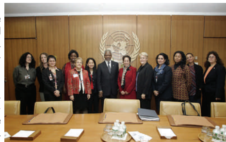
2006 Representantes de GEAR se reúnen con el ex Secretario General de la ONU Kofi Annan para discutir la reforma de la arquitectura para la igualdad de género (GEAR).

2006: El Secretario General de la ONU, Kofi Annan, convocó a un panel para trabajar en la Coherencia del Sistema de la ONU abordando tres áreas temáticas: desarrollo, asistencia humanitaria y medio ambiente. El género fue incluido en el análisis como “tema transversal”. Las organizaciones de derechos de las mujeres y de la sociedad civil, aportaron recomendaciones concretas al Panel acerca de la reforma de la arquitectura para la igualdad de género, que incluían la creación de una entidad específica para las mujeres con recursos sólidos; capacidad normativa, operativa y de supervisión; presencia en todos los países y liderada por una Secretaria General Adjunta. Las recomendaciones del Panel recogieron las sugerencias de la sociedad civil. Durante la reunión anual de la Comisión de la Condición Jurídica y Social de la Mujer, los grupos de mujeres de la sociedad civil también firmaron una petición para que se incluyera el género en la agenda del panel.