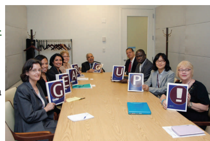
Junio de 2010. Representantes de GEAR se reúnen con el Presidente de la Asamblea General de la ONU